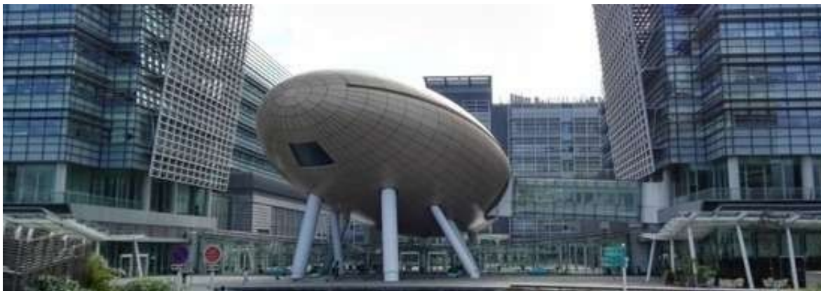
▲ 华为“诺亚方舟实验室”

英媒称，若是中国乐成在5G专利方面拥有更大份额，美国芯片团体高通将受到打击，中国部门装备制造商会受益，而中国移动运营商将为此“买单”。